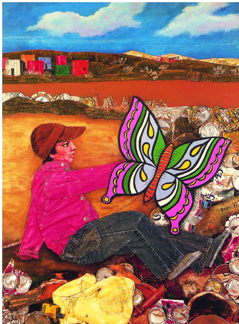
Antonio Berni. Sin título.