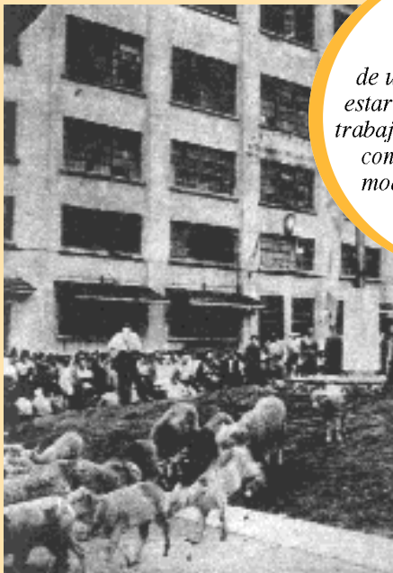
Fotografía: Revista Qué. Enero 1959.