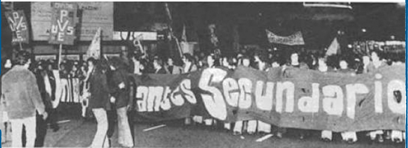
como popular en materia de educación debe reconstruir la conciencia popular a través de la escuela". Una propuesta de la UES.

Dentro de las múltiples acciones que habían realizado, lucharon por el otorgamiento del Boleto Estudiantil Secundario, participando en 1975 de las movilizaciones ante el Ministerio de Obras Públicas.