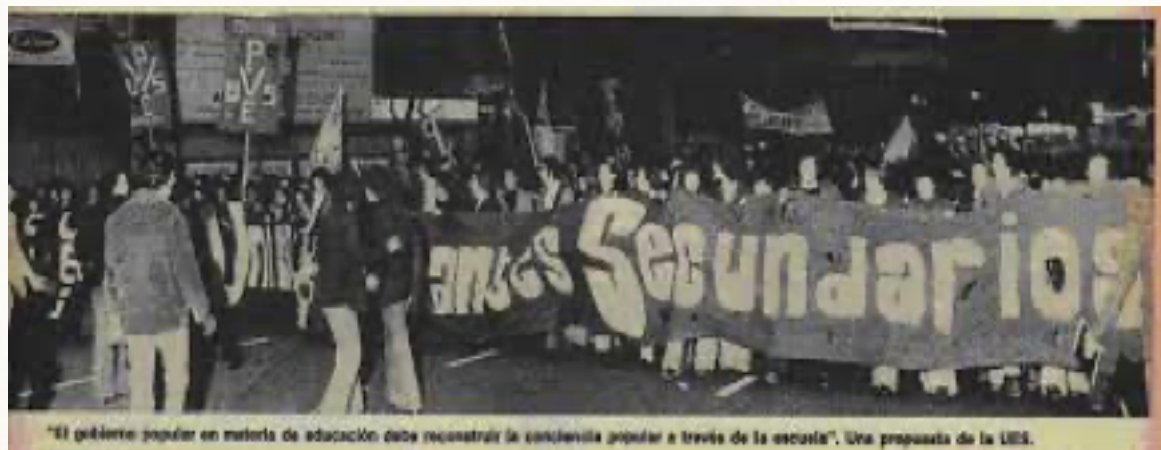
“El gobierno popular en materia de educación debe reconstruir la conciencia popular a través de la escuela”. Una propuesta de la UES.

Una de las tantas luchas que llevaron adelante fue la del Boleto Estudiantil Secundario: el costo del transporte era un gasto importante para lxs Estudiantes en un momento donde las Escuelas estaban instaladas únicamente en los centros urbanos.