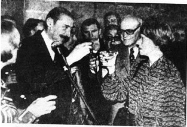
Jorge Rafael Videla y Ernestina Herrera de Noble brindan en la inauguración de la empresa "Papel Prensa". Los militares auspiciaron la formación del monopolio para que "Clarín" calle la represión y no diga nada de los desaparecidos. Todo el país pagó esta alianza aberrante.