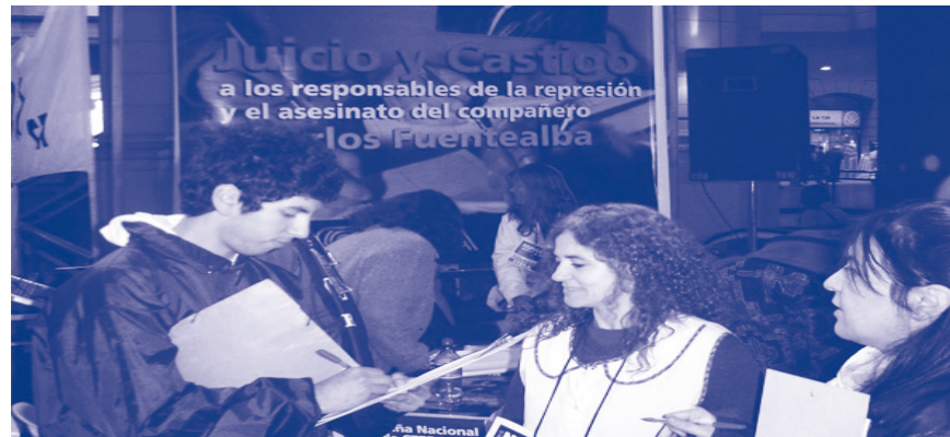
Campaña contra la impunidad: firma de petitorios