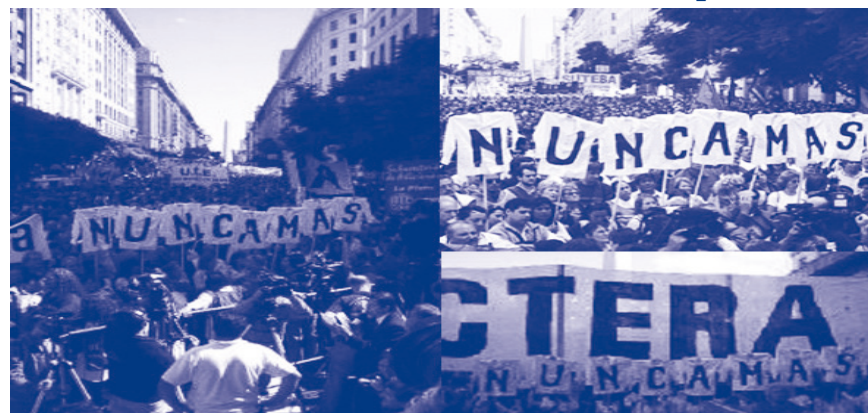
9 de abril de 2007 Paro Nacional y movilizaciones en todo el país / 4 de octubre Paro Nacional y movilizaciones