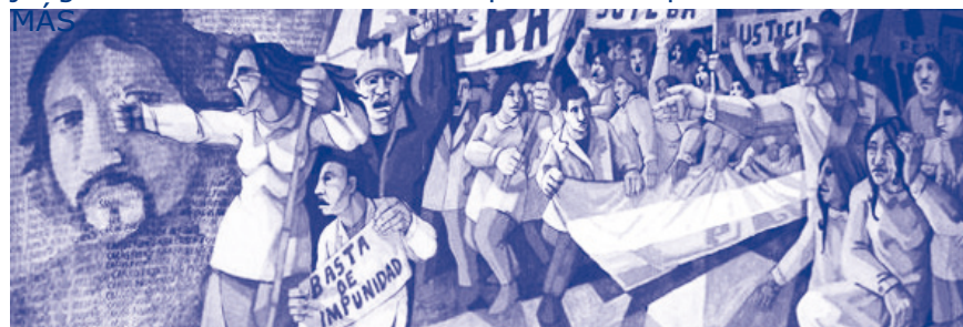
Concurso nacional de murales: "El asesinato de un maestro" / Actos, homenajes y murales por Carlos Fuentealba