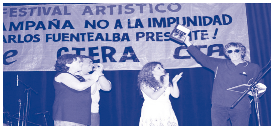
4 de diciembre Festival artístico contra la Impunidad y por Justicia.