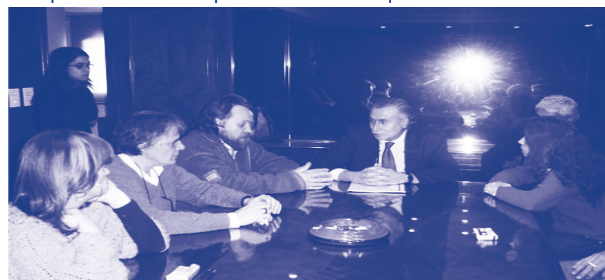
Reunión con Sec. de Derechos Humanos de la Nación / Reunión con la Comisión de Der. Humanos de Diputados