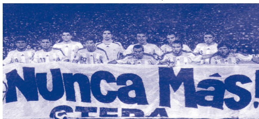
18 de abril La Selección Argentina de fútbol salió al campo de juego con una bandera firmada por CTERA que decía NUNCA MÁS