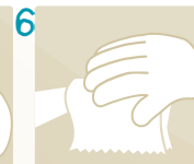
6 Secar ambas manos