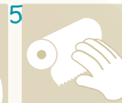
5 Tomar una toalla limpia o desechable