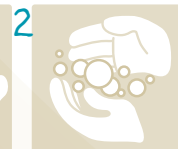
2 Colocar jabón