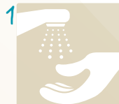
1 Mojarse las manos