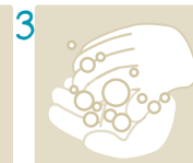
3 Frotar ambas manos